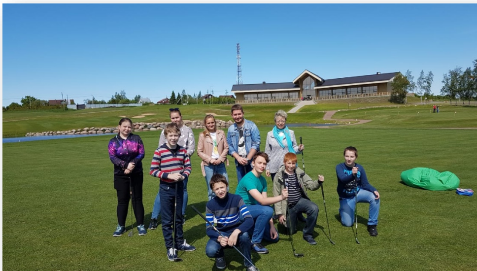
Посещение гольф-клуба «Земляничные поляны»