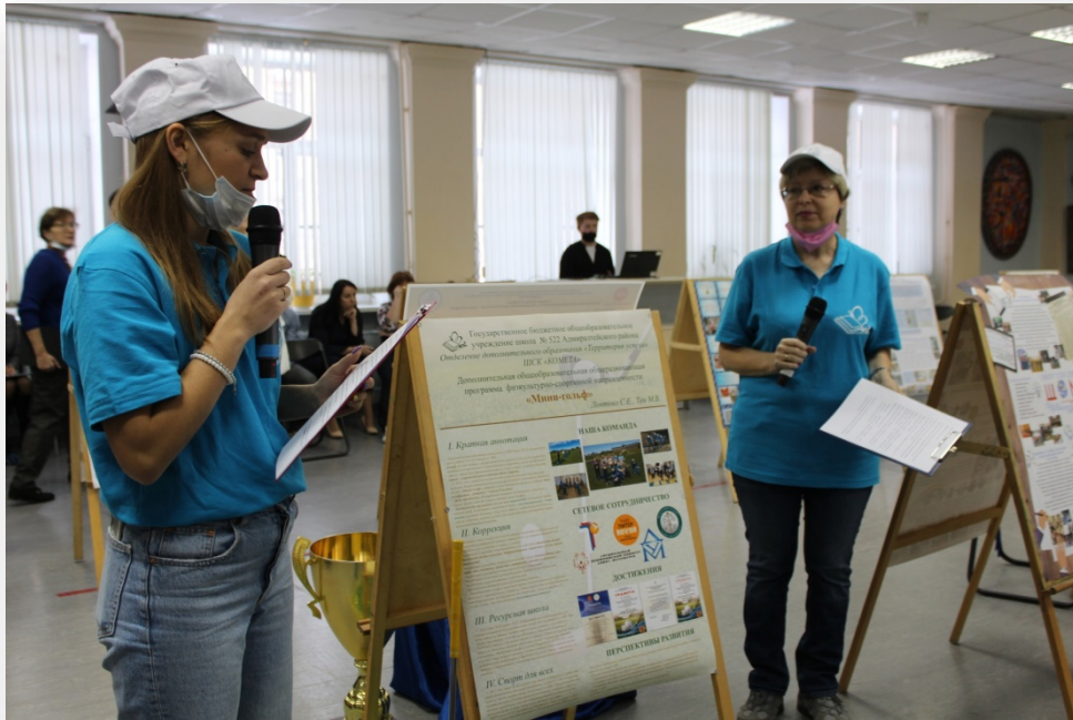
Открытый городской конкурс стендовых докладов педагогов дополнительного образования о детских творческих объединениях «Моя визитная карточка».