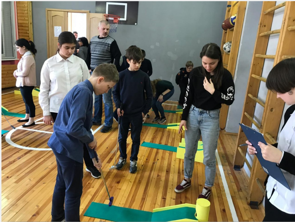
Городские соревнования по мини-гольфу «Спорт для всех»