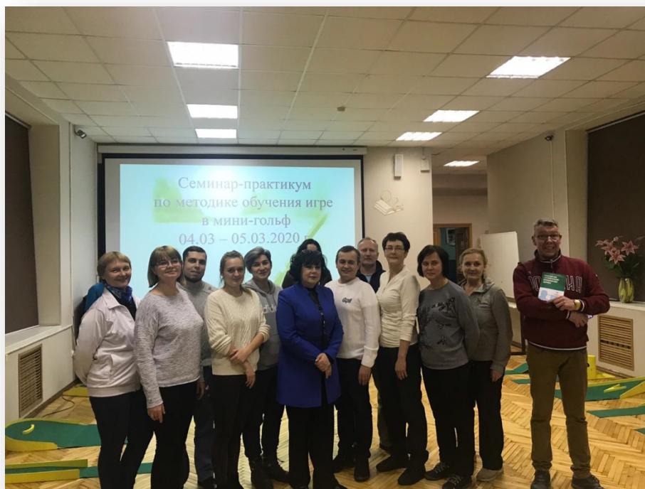
Проведение семинара-практикума по методике обучения игре в мини-гольф